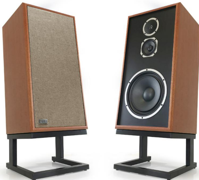
Zobrazeno v západoafrickém mahagonu

Kamenná praná mřížka a čedičová černá pletená mřížka dostupné na zvláštní objednávku